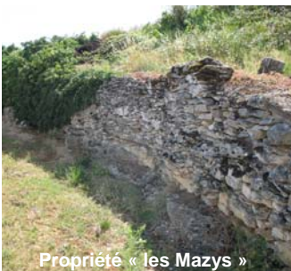
Propriété « les Mazys »

Les travaux seront confiés à l'association d'insertion SENTIERS et financés par la commune et le Conseil Général au titre du Plan Patrimoine et Insertion.