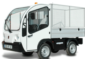
Goupil Industrie ©

En associant ses indéniables qualités pratiques à la protection de l'environnement, ce véhicule prolonge un peu plus encore notre engagement responsable en faveur du développement durable.