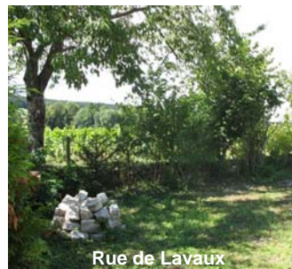
Rue de Lavaux